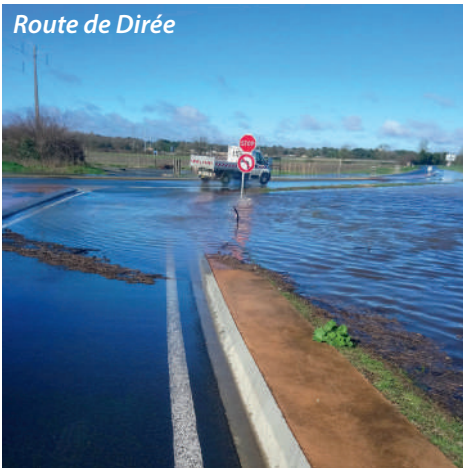
Route de Dirée

douce dans les marais de Lerpine et eau salée dans les marais des bords de Seudre (avec un coefficient de 117 le 12 mars).