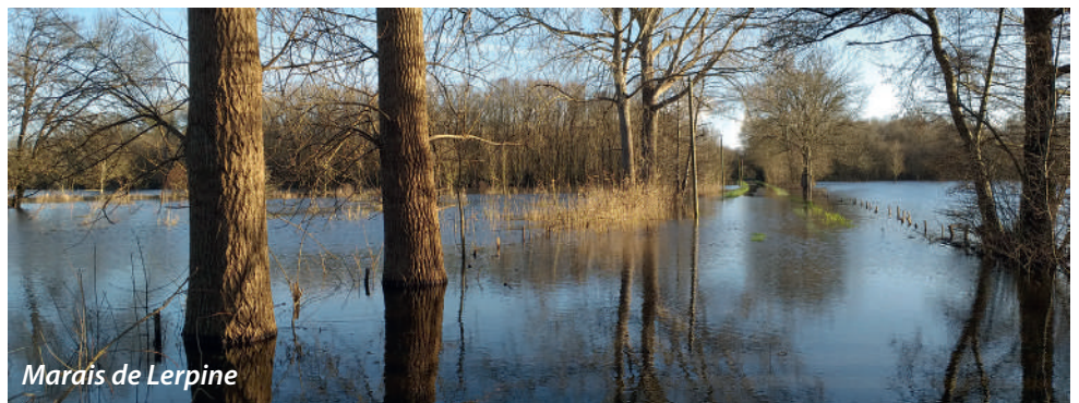
Marais de Lerpine